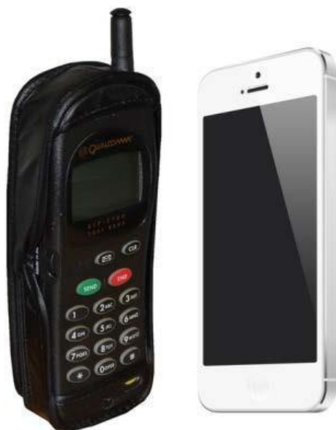
Εικόνα 1: Η εξέλιξη των συσκευών. Αριστερά το Qualcomm (δεκαετία του 1990) και δεξιά το iPhone 5s

Η εμπειρία περιήγησης στο διαδίκτυο και όλες οι επιπλέον λειτουργίες δεν είχαν την απαιτούμενη εμπειρία από τους καταναλωτές για να εκμεταλλευτούν σωστά την πλήρη δυνατότητα που προσέφεραν.